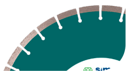
Disco sugerido (no incluido) R-6811600 General de obra R-6811700 General de obra