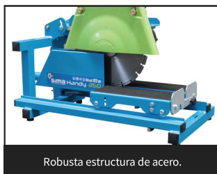
Robusta estructura de acero.