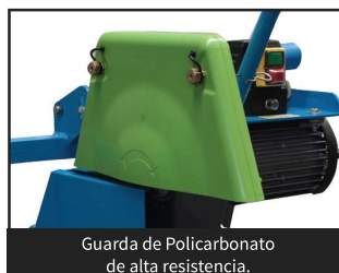
Guarda de Policarbonato de alta resistencia.