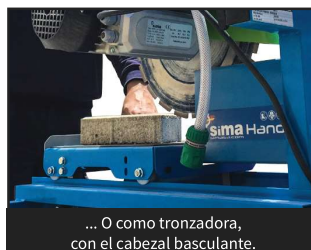
... O como tronzadora, con el cabezal basculante.