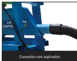
Conexión con aspirador.