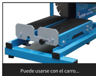
Puede usarse con el carro...