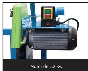
Motor de 2.2 Kw.