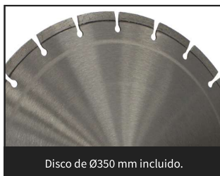
Disco de Ø350 mm incluido.