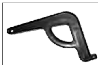
Dispositif pour la coupe en angles.