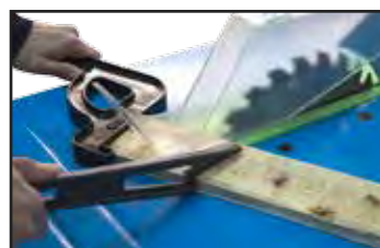
Mise en marche et découpe avec poussoir.