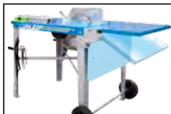
Table d' appui supplémentaire fournie.