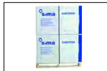
Encombrement pour 2 pièces.