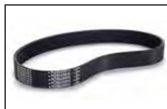
Transmission Poly V (moteur Yanmar).