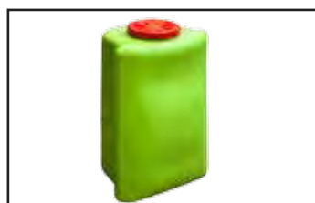
Réservoir de 40 L (COBRA 45) et 50L (COBRA 60).