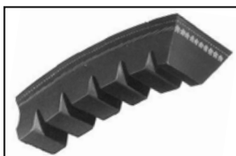
Transmission trapézoïdale (moteur Honda).