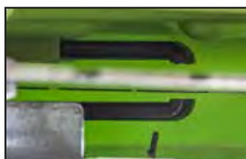
Fourchette de refroidissement sur les deux faces du disque