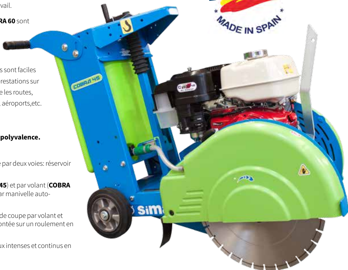
COBRA 45 HONDA