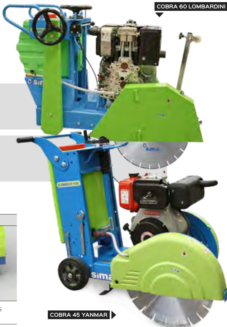
COBRA 60 LOMBARDINI

Le tracto-pelle commence à faire son travail.