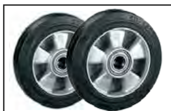
Roues en caoutchouc avec roulements à bille.