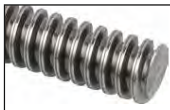
Tige filetée trapézoïdale.