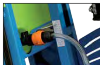
Indicateur de profondeur de coupe.