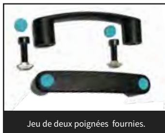
Jeu de deux poignées fournies.