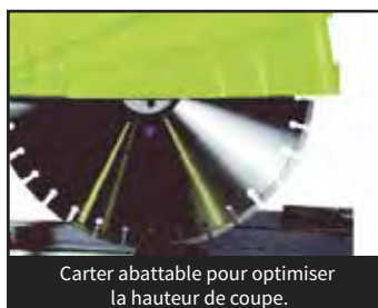
Carter abattable pour optimiser la hauteur de coupe.