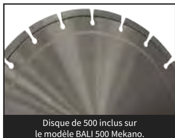
Disque de 500 inclus sur le modèle BALI 500 Mekano.