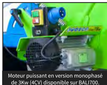
Moteur puissant en version monophasé de 3Kw (4CV) disponible sur BALI700.