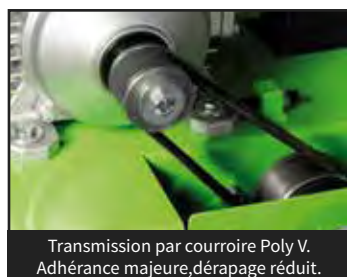
Transmission par courroie Poly V. Adhérence majeure, dérapage réduit.